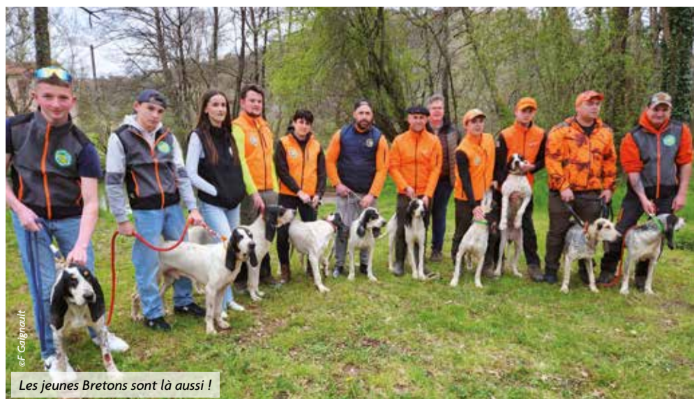
Les jeunes Bretons sont là aussi !

« Il est aguerri par les nombreux brevets de chasse qu'il fait dans toute la France. Il a lâché dix Gascons Saintongeais dans la forêt de Grésigne. Nous avons pu voir un joli rapprocher d'une vingtaine de minutes. Ensuite, une